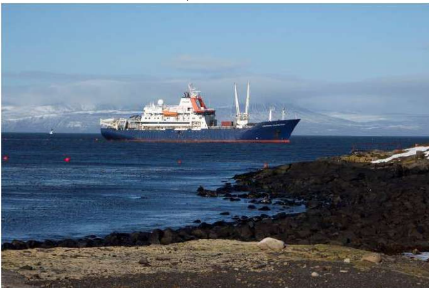
Le Marion Dufresne dans le Golfe du Morbihan en face de Port-aux-Français.

été presque une centaine avec les contractuels et les chercheurs venant pour de courts séjours. Aujourd'hui nous ne sommes plus que 42 hivernants répartis selon plusieurs fonctions (chef de district, cuisine, médecin, militaires, ouvriers polyvalents, ingénieurs du CNES, météo, et volontaires civiques de la réserve naturelle et de l'Institut Paul-Emile Victor).