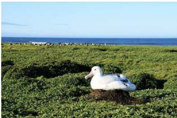
Grand Albatros sur son nid

Sur l'île Haute, où je travaille le plus souvent, j'effectue des suivis de la reproduction de 3 espèces de Pétrels (le pétrel à menton blanc, le pétrel de Kerguelen et le pétrel noir, qui est une espèce différente du pétrel noir de Bourbon de la Réunion), ainsi que des Cormorans de Kerguelen et de deux espèces de Sternes (la sterne de Kerguelen et la sterne Antarctique). Sur d'autres îles ou sur la péninsule Courbet, j'effectue également un suivi démographique des manchots Papou, des canards d'Eaton et des goélands Dominicain, et des comptages de nids d'Albatros Hurlleur, d'otaries de Kerguelen et de dauphins de Commerson.