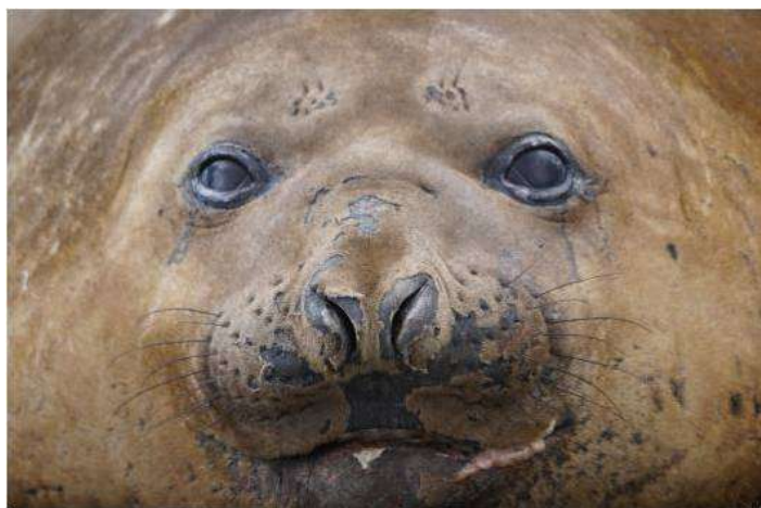
Eléphant de mer