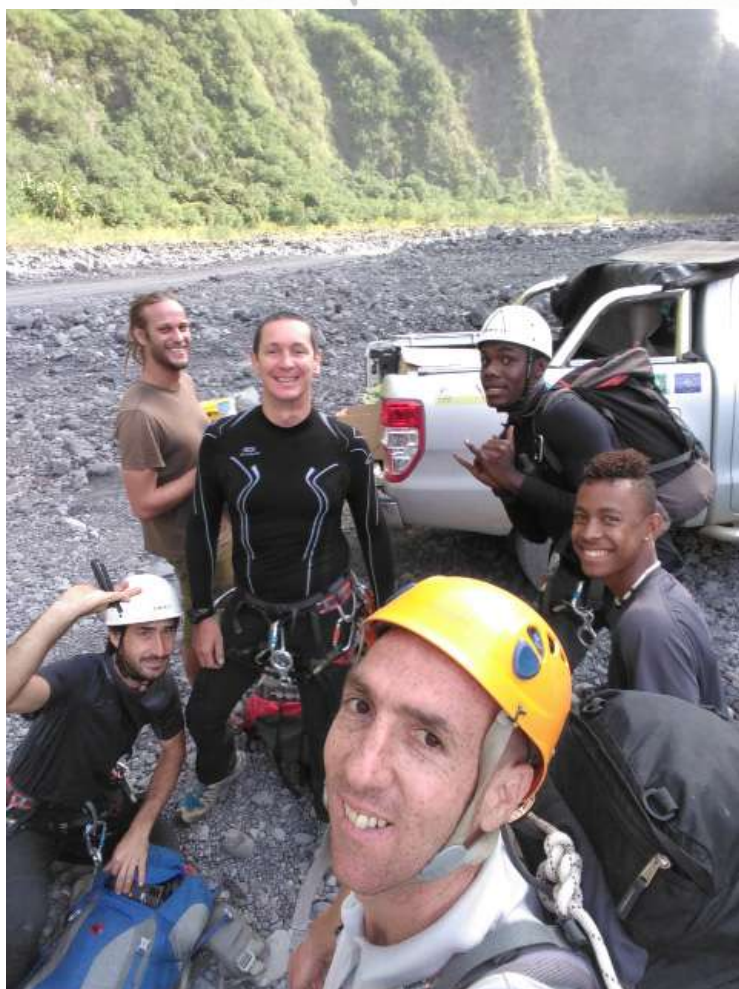
L'équipe après la découverte du premier terrier