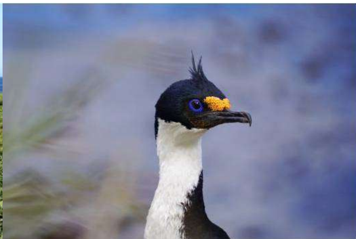
Cormoran de Kerguelen