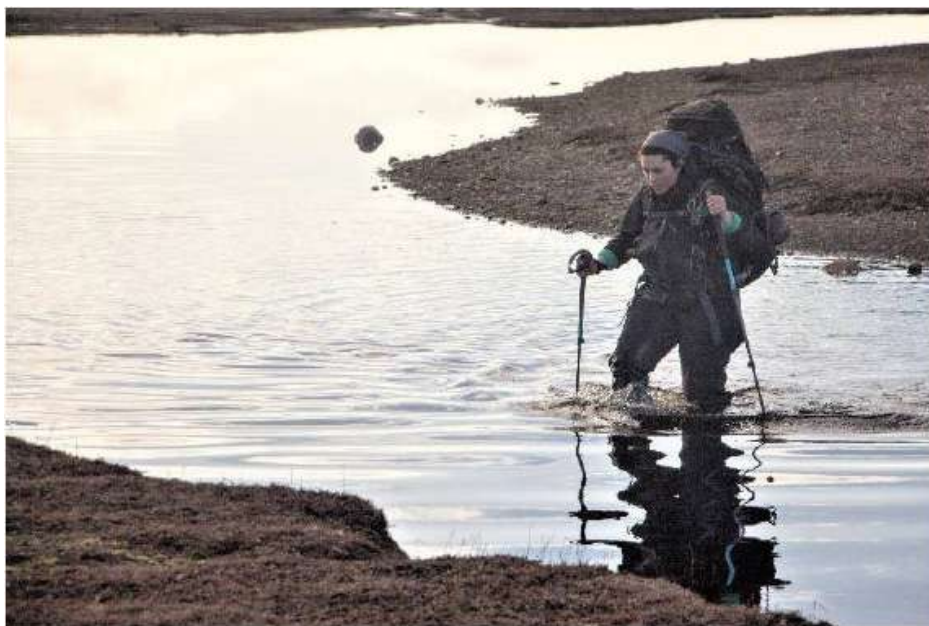
Traversée de rivière.

Au quotidien, j'alterne entre des sessions de terrain (que l'on appelle « manip », les personnes venant aider sont appelées « manipeurs »), plutôt sportives, et la vie sur base à l'inverse, plus tranquille. Le terrain se passe sur des îles du Golfe du Morbihan (beaucoup de Bretons sont passés par Kerguelen...) et sur d'autres lieux de la grande île, accessibles entre 1 et 2 jours de marche. Sur la plupart des sites on vit en « cabane ». Certaines sont grand luxe, équipées d'électricité et d'eau courante, mais la plupart du temps l'ambiance est à la bougie et aux allers- retours au ruisseau ou plus souvent à la cuve.