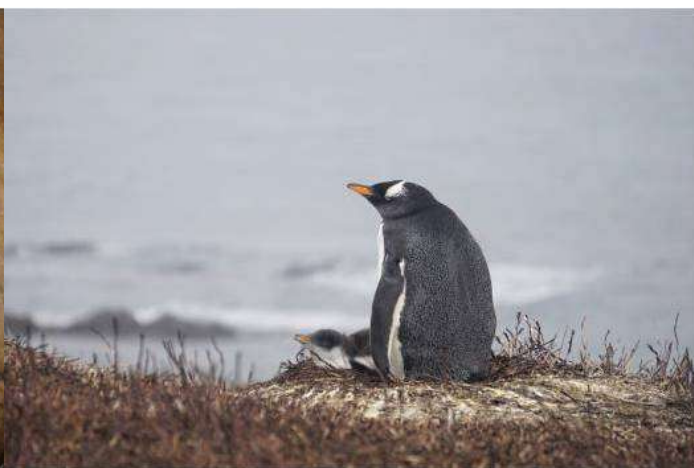
Manchot papou adulte et poussin

Les suivis des pétrels à menton blanc, notamment, sont particulièrement importants car cette espèce est l'une des plus impactée par les prises accidentelles de pêche palangrière. Chaque année les informations concernant les paramètres démographiques de la colonie suivie sur l'île Haute sont transférées à la CCAMLR (Commission pour la conservation de la faune et de la flore antarctique marine) et à l'ACAP (Accord de conservation des Albatros et Pétrels).