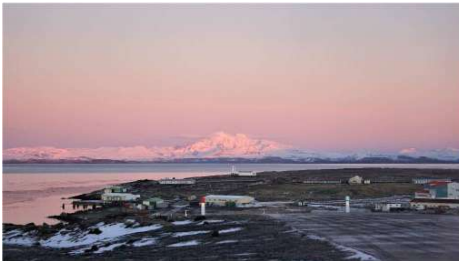
Port-aux-Français et le Mont Ross au lever du jour.

Je vis sur la base de Port-aux-Français, où nous avons plusieurs bâtiments de logement et de collectivité dont les noms sont souvent des jeux de mots, restaurant (Ti-Ker), un hôpital (Samuker), un cinéma (Cinéker), un bar (Totoche)... Il y a aussi les bureaux, une antenne du CNES et de Météo France. Pendant la campagne d'été (Novembre – Avril) , nous avons