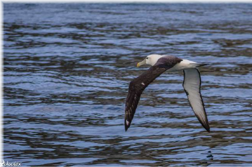
Albatros à cap blanche (Thalassarche cauta)

- Si vous êtes amateurs de sensations fortes et d'attractions en tous genres, vous en aurez pour votre argent : saut en élastiques, jet-boat, spectacles maoris, kayak de mer, ski, jetboat, saut en parachute, zorbing, tempête de neige, ...etc Enfin, vous pouvez profiter de l'accueil, de la gentillesse des kiwis (les habitants) et d'une manière de vivre exceptionnelle.