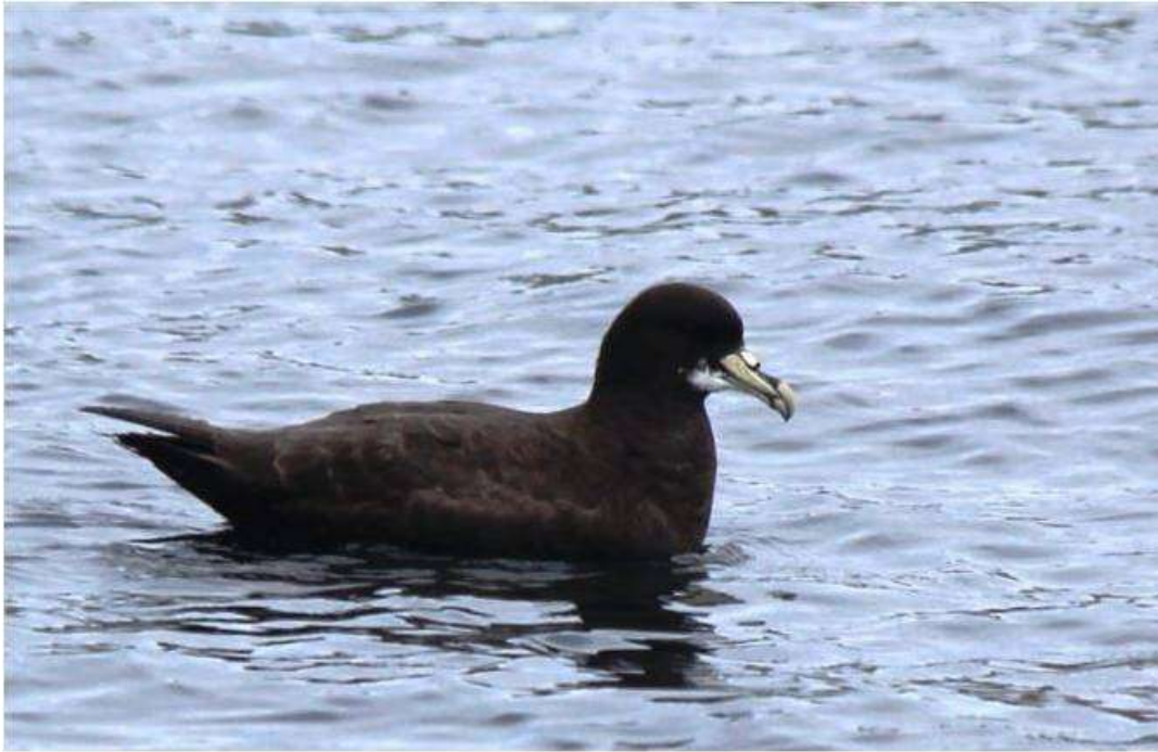
Pétrel à menton blanc.

Presque 13 mois ont passés sans l'ombre d'un ennui, durant lesquels j'ai vécu cette aventure à pleins poumons pour ne pas en perdre une miette. A présent qu'approche l'heure du retour, je prends enfin le temps de faire partager mon expérience aux amis séoriens. Ici il y a un dicton qui dit que « ce qui se passe à Kerguelen, reste à Kerguelen ». Il témoigne de la difficulté de raconter cette aventure où l'on a l'impression d'être complètement hors du temps. J'espère tout de même avoir pu vous faire partager un peu de cette extraordinaire mission et avoir éveillé votre intérêt pour ce magnifique bout du monde préservé.