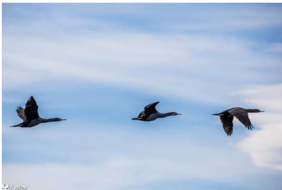
Grand Cormoran ( Phalacrocorax carbo )