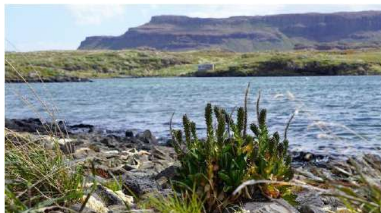
Un chou de Kerguelen, et la cabane de l'île Haute au second plan.

Nous sommes ravitaillés et transportés par le Marion Dufresne, unique bateau effectuant une rotation entre les autres îles australes (Archipel de Crozet, Amsterdam et St Paul) et les Iles Eparses (Europa, Bassas da India, Tromelin, Juan de Nova et les Glorieuses), avec cinq rotations par an pour les îles subantarctiques. Lorsque le bateau arrive sur les îles on appelle ça les « OP » (Opération Portuaire), c'est le temps de la réception des vivres, des colis et des lettres, des arrivées de personnes et aussi également du départ émouvant des personnes avec qui nous avons vécu ici.