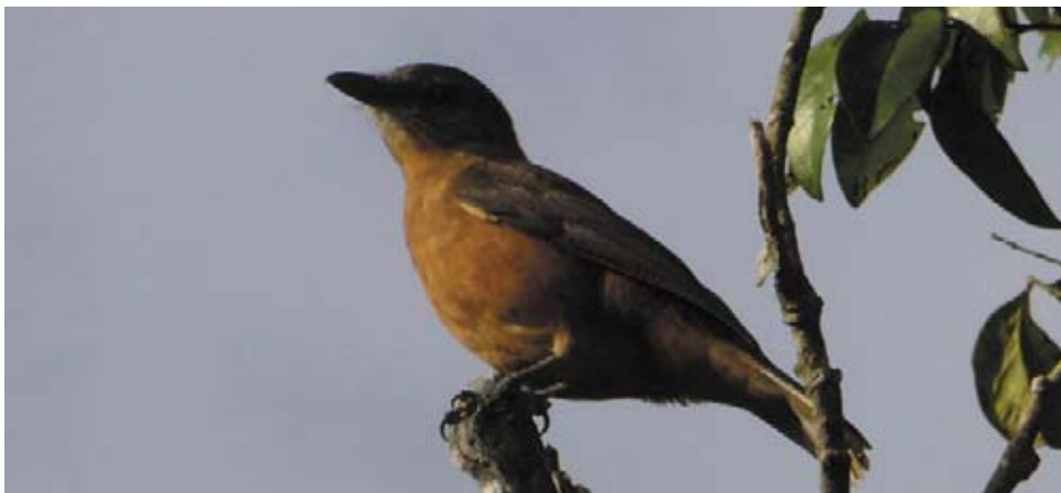
Femelle du Tuit tuit mauricien

• Brigade de la Nature de l'Océan Indien : Expéditions 'Pétrels de Barau', cas de braconnage signalés et saisies d'oiseaux en captivité (Bulbul de la Réunion).