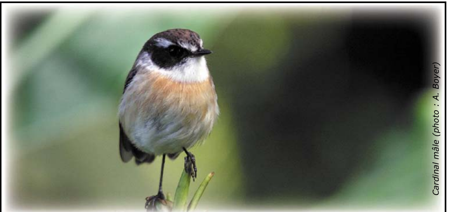
Cardinal mâle