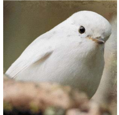
Cas de leucisme chez un Tec tec

Chez les albinos : un Bulbul orphée, une salangane et un Tec-tec entièrement albinos.