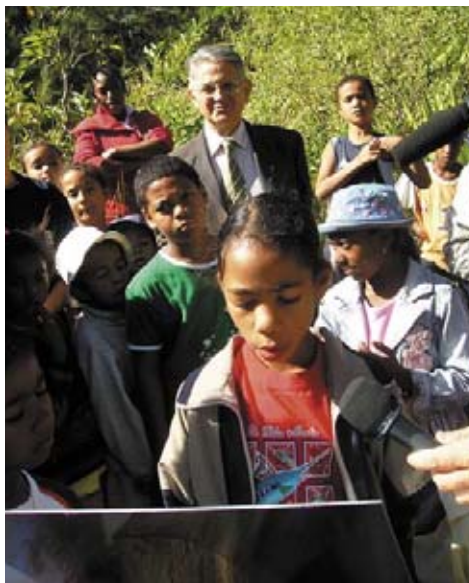
Inauguration du sentier d'interprétation des oiseaux de Grand Place (Mafate) avec M. Le Recteur de la Réunion

Un autre projet a été mis en oeuvre, avec une classe de SEGPA de St Denis, pour la fabrication de 'boîtes à Pétrels' destinées aux relais du réseau de sauvetage. Ce travail a permis de valoriser le travail de ces élèves en difficulté et de les sensibiliser à la protection des oiseaux (animation et sortie sur le terrain).