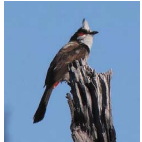
Albinisme partiel de la crête chez le Merle Maurice