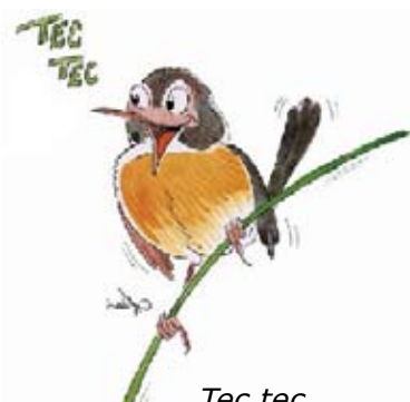
Tec tec (dessin : A. Nouailhat)

pris en charge sur les fonds propres de la S.E.O.R. : - sorties sur le terrain, - lettre d'information de la SEOR, participation de la SEOR aux commissions sur invitation de la Préfecture, de la DIREN.... Fin de la CPO en décembre 2007.