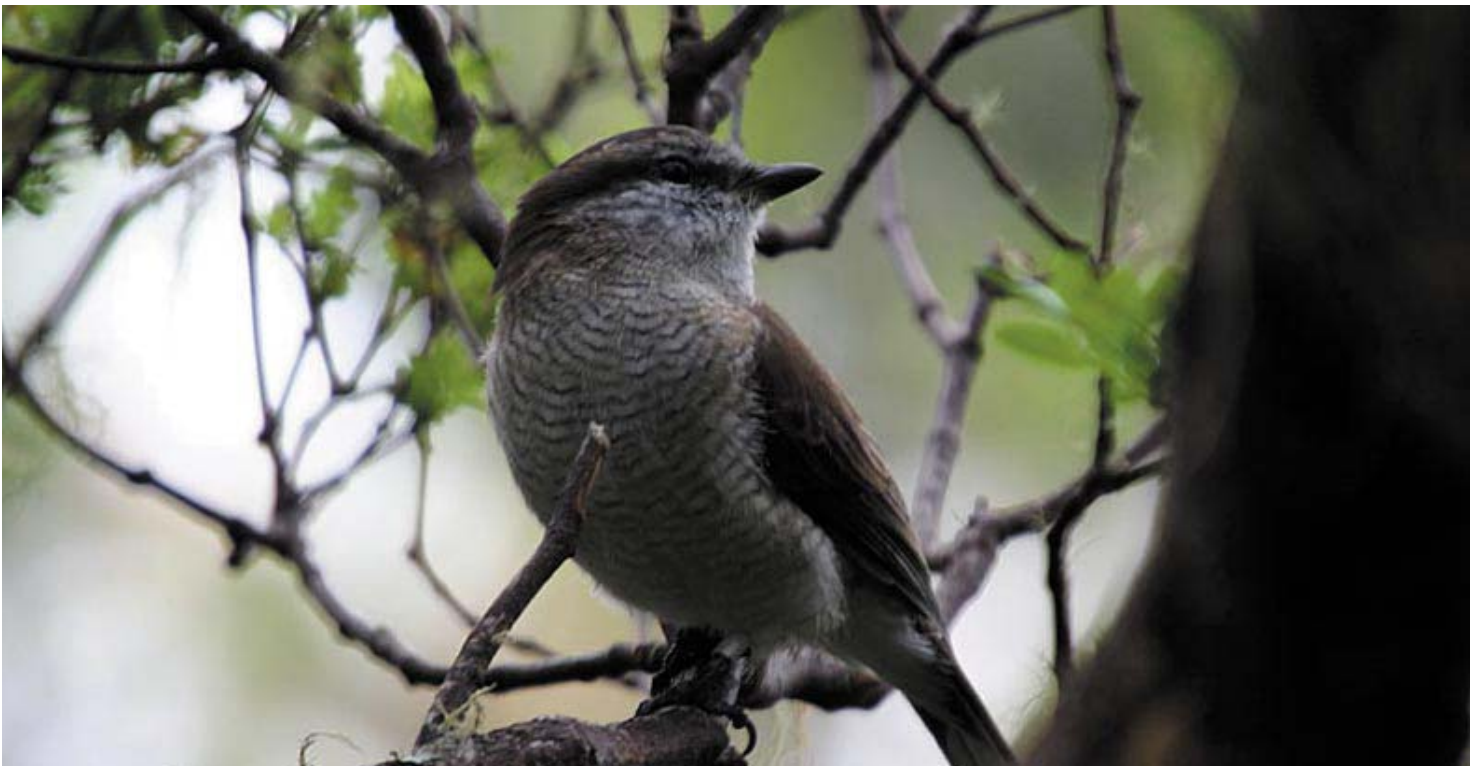
Femelle Tuit-tuit baguée

Pour plus de détails sur ces actions, il est possible de demander le bilan d'activité 2007 de la SEOR sur la RNRE, à fouillotd@seor.fr