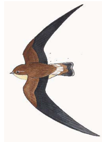
Dessin : A. Nouailhat

- Extraction site du Colosse, Mairie St André: (25/01/07 et 19/07/07);