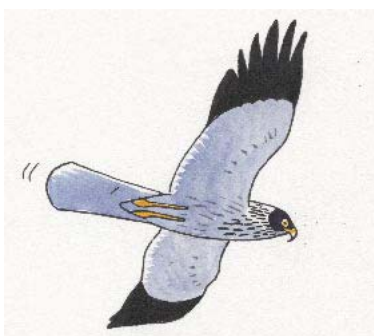
Papangue mâle (dessin : A. Nouailhat)