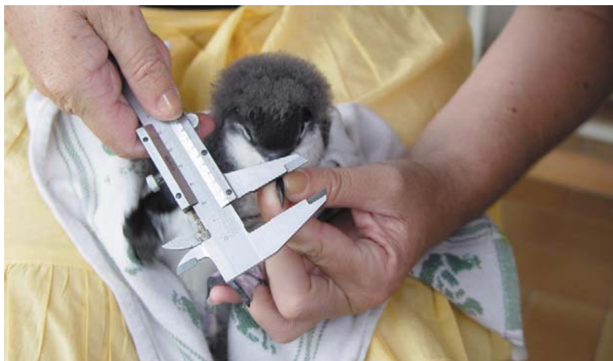
Prise de mesure du bec sur un Puffin de Baillon