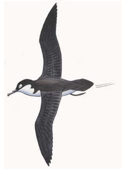
Dessin : A. Nouailhat

Evaluation de la prise en compte des mesures environnementales dans les aménagements liés aux basculement de l'eau.