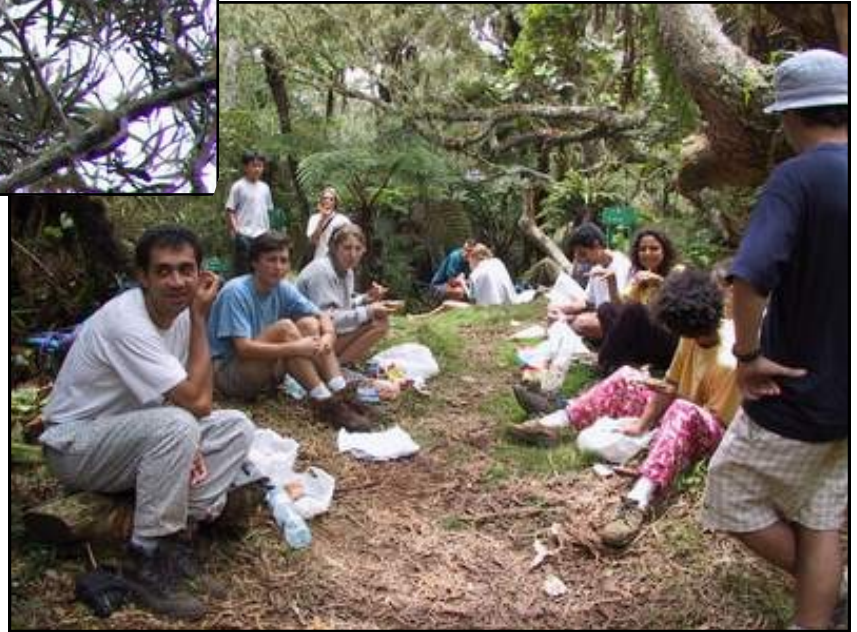
Quelques uns des Séoriens chanceux ont pu observé... ...le nid de Tuit-tuit lors de la sortie.

Merci à Lucien pour ces magni- fiques photos