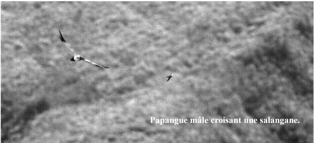
Papangue mâle croisant une salangane.

Enfin le jeune rapace resserre ses ailes et rejoint ses camarades quelques centaines de mètres plus