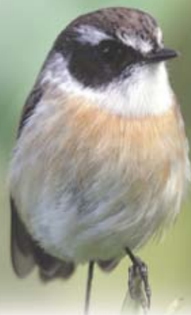
Tec-tec mâle