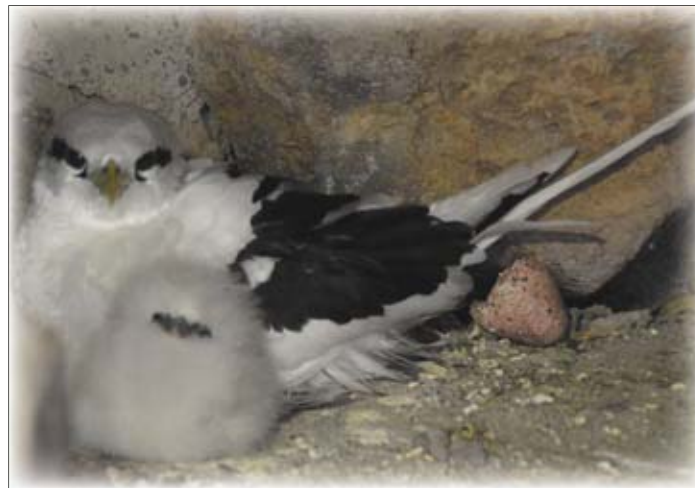
Phaétons à brins blancs

Le 15/09/2011, à Bras-Panon, 10 individus, à Basse Vallée, à 710 m d'altitude, dans la forêt indigène (K.L.P)