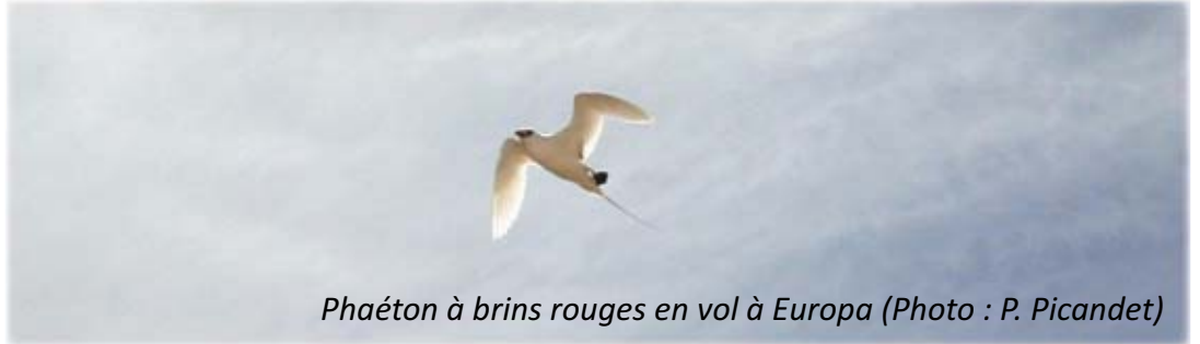
Phaéton à brins rouges en vol à Europa