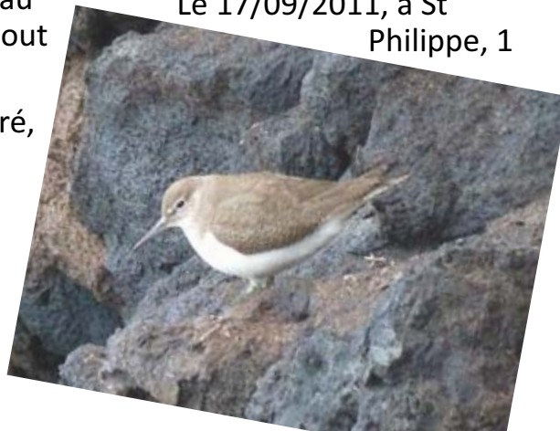
Chevalier guignette au cap Méchant (Photo : M. Sanchez)

individu, au Cap méchant, au niveau de la falaise en bord de mer (M.Sz)